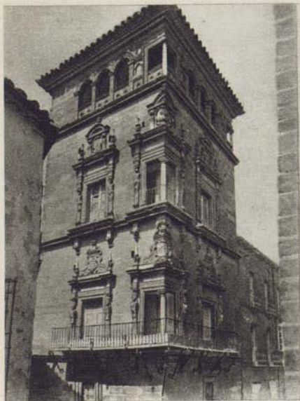
Un palais privé

recouverts de fresques magnifiques. Le Rétoble Mayor de la Chapelle est d'un grand mérite et l'ensemble une des meilleurs œuvres non seulement d'Úbeda, mais de toute l'Andalousie.