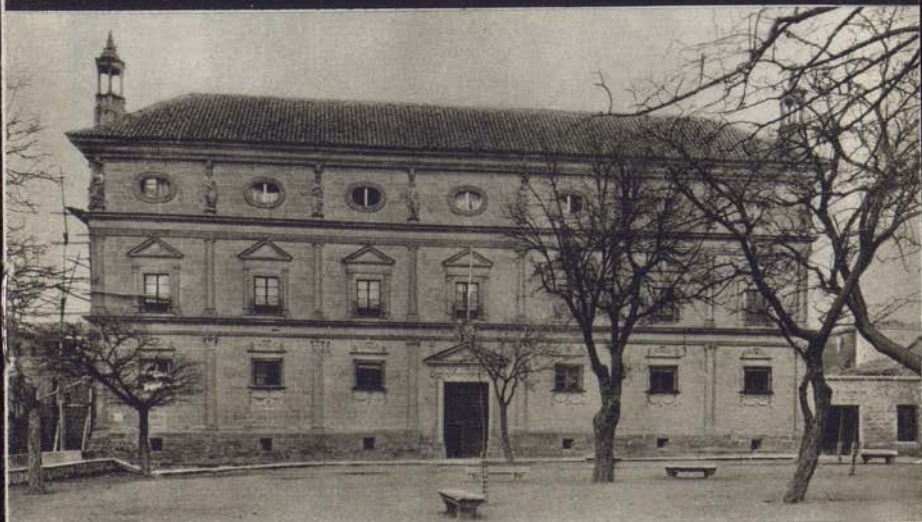
Hôtel de Ville. Palais des Chânes

ÚBEDA (30.000 habitants) est située sur la célèbre colline qui porte son nom sur la rive droite et à une certaine distance du Guadalquivir, presque au centre de la province de Jaén, à 56 kms. de son chef-lieu.