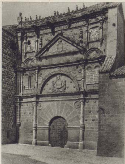
Palais des Dávalos