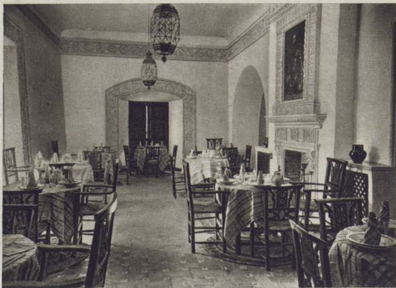
Intérieur du Parador (Hôtellerie) du P. N. T.

On ne peut rien affirmer de certain sur les origines d'Úbeda. On sait seulement avec certitude qu'elle existait du temps des Arabes, sous le nom d'Obdah ou Ubadzza, et que c'était une place forte de grande importance. Le Roi Saint Ferdinand la reconquit en 1234. Les rois de Castille la distinguèrent beaucoup, mais sa puissance diminua lors des guerres avec les Maures de Grenade et les luttes civiles entre les nobles de la ville.