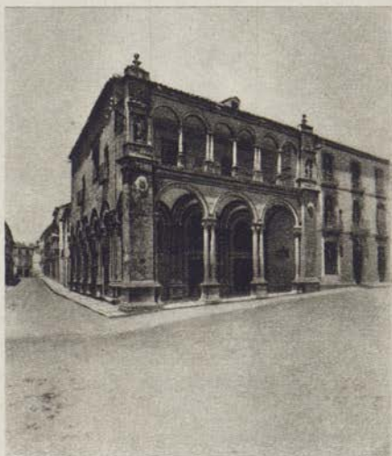
Ancien Hôtel de Ville

HOTEL COMERCIO — Pension complète: 10 pesetas