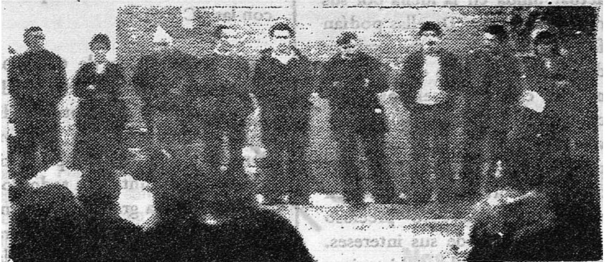
Primera asamblea de los sectores escindidos de CC.OO. en Coslada (Noviembre de 1976)