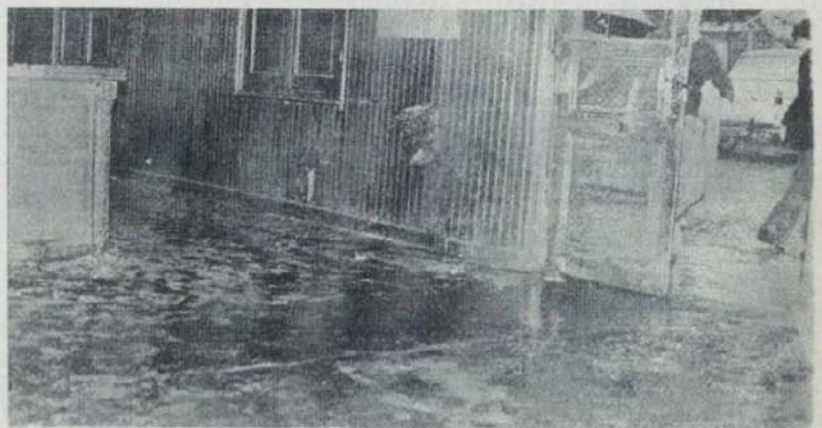
Interior de la estación de Amara donde cayó muerto el policía armado.